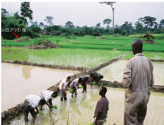
図2. アフリカの未利用低地の開発