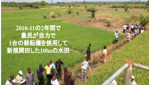
ナイジェリアサイトの適地適田開発と訓練の進行

2011年11月、ガーナ科学技術省(大臣が出席)と農業省、筑波の国際農研(JIRCAS)、Africa Rice Center、近畿大Sawah projectは農民の自力水田開発技術に関する最初の国際ワークショップをクマシ市で共催。ガーナ、ナイジェリア、トーゴ、ベナンから140名の技術者・普及員が参加。篤農(農民グループを含む)は2010-2011時点では、1-2年で5-10haを新規開田し、年間20-50トン以上の籾生産を達成できるように進化。