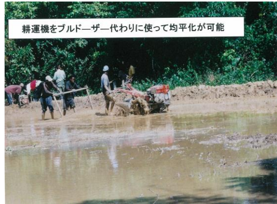
左下の写真の道路を挟んだ反対側で農民がSawah Ecotechnologyで水田を自力で開発。水田は籾収量4t/ha以上を可能にし、10t/haの超高収量技術の開発研究も意味を持つようになる。(2008年)